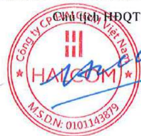
Nguyễn Quang Huân

(Các thuyết minh từ trang 10 đến trang 40 là bộ phận hợp thành của Báo cáo tài chính hợp nhất này)